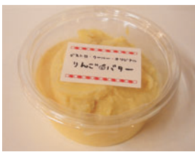
創業以来の看板人気商品「りんごバター」わざわざこれを求めて来店される方も少なくない。

独立開業後は、フレンチを気軽に楽しんでもらう店づくりに取り組んできた。店舗や装飾品は本場ビストロのイメージを取り入れた。お店を紹介する掲示物や看板はシェフの奥さんによる手書き、メニューやコースターなどの小物も手作り、これらがやわらかい空間を演出している。当店の看板商品シェフ手作りの「りんごバター」はどこか素朴でやさしい味。当店のコンセプトを象徴している。